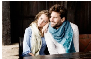
QBEE LUXURY: LA "NATURALIDAD" DEL COMPLEMENTO