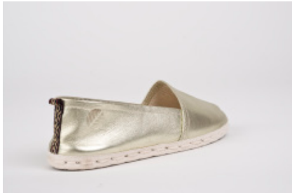
Flat Corso light gold

Tres son las diferencias frente al resto de alpargatas: la suela, de una goma patentada por su durabilidad, resistencia al agua y flexibilidad; el packaging, un tubo de cartón adornado con la tira de pampa característica de los zapatos; y la piel, procedente de nobuck uruguayo, caracterizado por conseguir el mejor cuero frente al desgaste, sin mencionar su aspecto y su tacto, inimitables. Los detalles también proporcionan ese algo que convierte a esta marca en única. Las tiras que decoran los zapatos se inspiran en diseños étnicos y son fabricadas con hilos naturales teñidos ecológicamente.