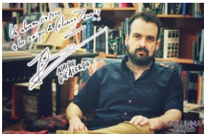
ENTREVISTA: NACHO VIGALONDO (OPEN WINDOWS)