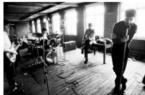
LOS MEJORES DOCUMENTALES DE MÚSICA (I)